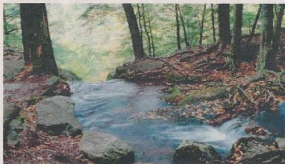
NELLA FOTOGRAFIA IN ALTO IL TORRENTE CHIEBBIA, A LATO IL RIO VALGRANDE