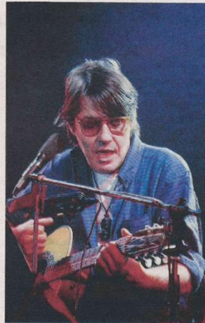
FABRIZIO DE ANDRÉ

"De André e Guccini - Genova, l'Emilia e l'America" si annuncia come un importante appuntamento di grande fascino, capace di emozionare e far rivivere, in una sera, la poesia e la forza di due voci senza tem-