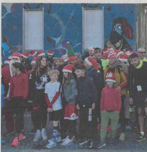
La partenza della corsa dei Babbi Natale, lo scorso anno

Il 21 dicembre piazza Martiri ospiterà la festa per bambini e famiglie