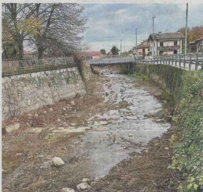
IL torrente Chiebbia

dell'alveo, in un'ottica di messa in sicurezza del territorio. Conseguenza evidente di tale azione è anche la rimozione della vegetazione spontanea e infestante - in tale zona particolarmente abbondante - ancorché non ritenuta pericolosa. Di grande importanza, al contrario, il risultato dell'aumento di resilienza del territorio soprattutto in relazione agli eventi meteorologici estremi, che sono diventati sempre più diffusi e violenti. Il progetto, di ampio respiro, oltre al torrente Chiebbia interesserà il rio Valgrande, con la pulizia della vasca di laminazione nella zona collinare: obiettivo, quello di mantenere in efficienza la vasca, rallentando il deflusso delle acque meteoriche e contenendo il rischio di erosioni e frane determinate dall'eccessiva velocità di scorrimento.