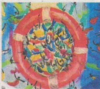
L'immagine della locandina