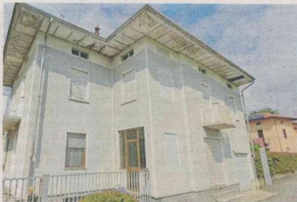
LA FUTURA SEDE della Pro loco di Vigliano Biellese. A lato la planimetria del progetto studiato dal Comune

Il Comune ha infatti acquistato, con 165mila euro, quegli spazi, passati alla Edilmecos s.r.l. di Vinovo dopo la costruzione della nuova sede Asl di via Milano. L'azienda edile aveva ipotizzato di trasformarli in mini alloggi, ma il progetto non era mai andato oltre l'idea, lasciando l'immobile fermo e inutilizzato. Ora