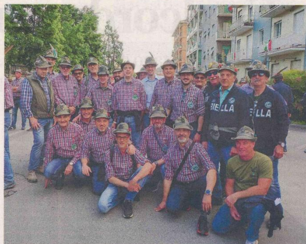
UNA RAPPRESENTANZA DELLE PENNE NERE VIGLIANESI

tenere vive e tramandare le tradizioni degli Alpini; di rafforzare con vincoli di fratellanza e curarne, entro i limiti di competenza, gli interessi e l'assistenza; di favorire i rapporti con i Reparti e con gli Alpini in armi.