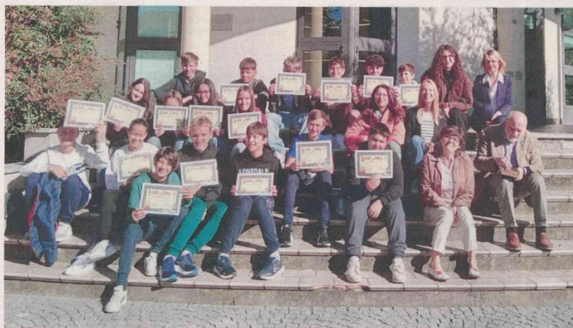
I RAGAZZI DELLE SCUOLE MEDIE CHE HANNO RICEVUTO GLI ATTESTATI DI MERITO