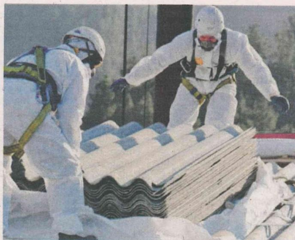
LA BONIFICA del pericoloso amianto (immagine di repertorio)