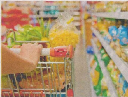
LE CARTE "DEDICATA A TE" POTRANNO ESSERE UTILIZZATE PER FARE LA SPESA

I beneficiari "non" hanno presentato domanda. L'elenco di Vigliano comprende 74 nuclei beneficiari, si tratta di cittadini che alla data della pubblicazione del decreto sono risultati regolarmente iscritti all'anagrafe co-