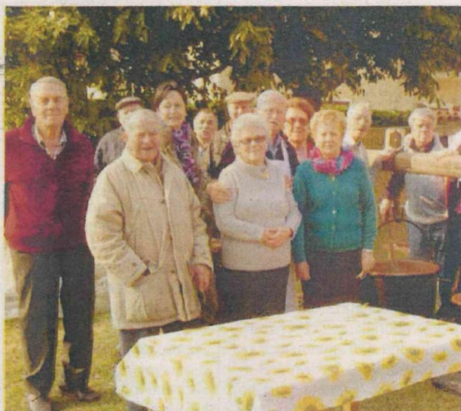
UN GRUPPO DI OSPITI DEL CENTRO INCONTRO DI VIGLIANO