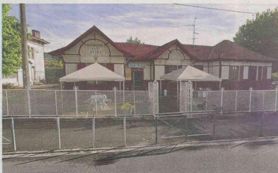
Il circolo Alpi Erios di Vigliano