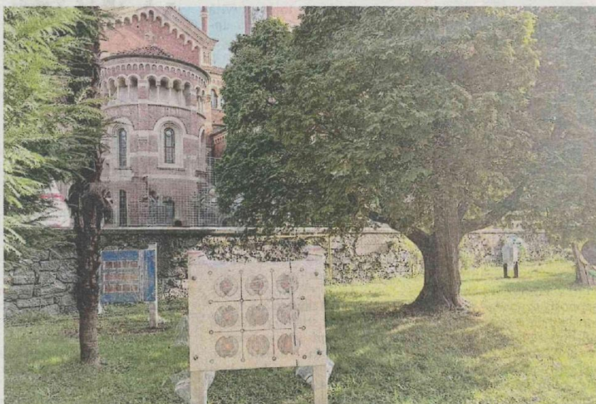
Un'immagine del nuovo spazio all'aperto con il percorso sensoriale

■ ■ È un luogo anche per favorire l'inclusione dei bimbi con bisogni educativi speciali