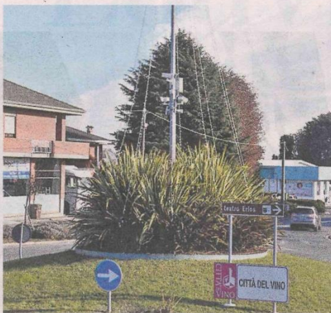
Una delle rotatorie «fiorite» presenti a Vigliano