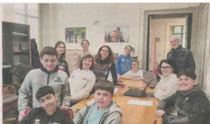
I componenti del Consiglio comunale di ragazzi di Vigliano

DOMANI SERA AI MICROFONI DI "SPAZIO IVREA"