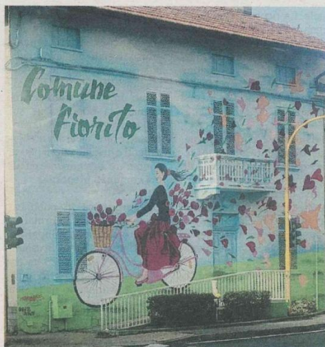
VIGLIANO COMUNE FIORITO il murales su Via Milano