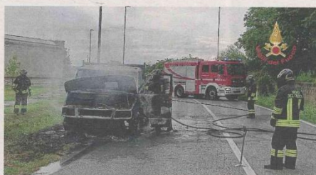
Il furgone andato in fiamme

Sul posto sono intervenuti in tempi rapidissimi i vigili del fuoco di Biella, allertati da chi aveva assistito alla scena. La squadra, giunta con gli automezzi di servizio, ha immediatamente messo in atto le procedure di sicurezza, provvedendo all'estinzione completa delle fiamme e alla successiva bonifica del mezzo. Fondamentale l'azione dei pompieri, che ha evitato che l'incendio potesse propagarsi ulteriormente o