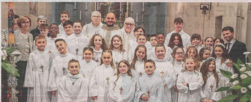
L'altro gruppo di bambini della parrocchia di Santa Maria Assunta che ha ricevuto la Prima Comunione