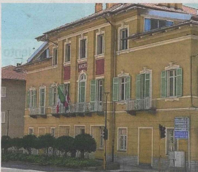
Il municipio di Vigliano