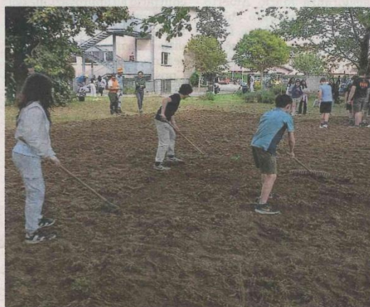
Al lavoro per preparare il terreno