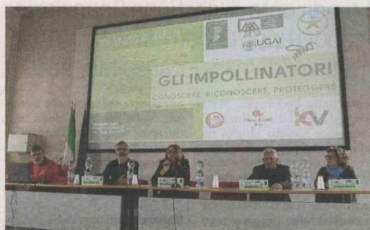
Il tavolo dei relatori al convegno di venerdì

■ Un piccolo ecosistema capace di accogliere e proteggere gli impollinatori