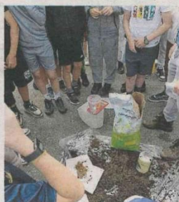
I ragazzi durante le attività