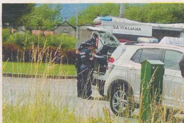
L'INTERVENTO DEI SOCCORRITORI SUL LUOGO DELL'INCIDENTE