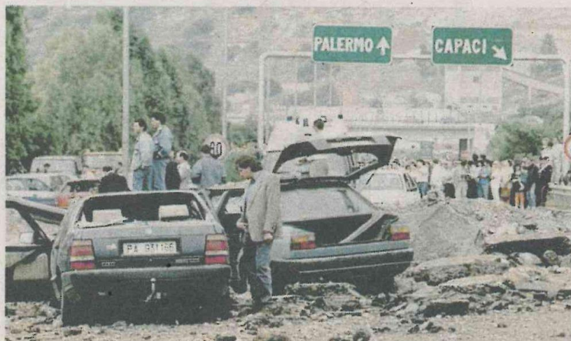
UNA FOTO STORICA della scena di Capaci dove ci fu la strage