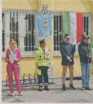
UN'IMMAGINE DEL 25 APRILE (REPERTORIO)