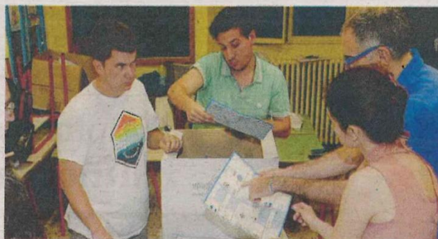
GLI SCRUTATORI SARANNO IMPEGNATI DURANTE IL REFERENDUM DI GIUGNO

In occasione delle consultazioni referendarie di domenica 8 e lunedì 9 giugno, i cittadini interessati a svolgere l'incarico di scrutatore di seggio sono invitati a comunicare la propria disponibilità entro martedì 13 maggio. A darne informazione è l'amministrazione comunale. Si precisa che per poter essere nominati scrutatori è sufficiente essere iscritti nelle liste elettorali