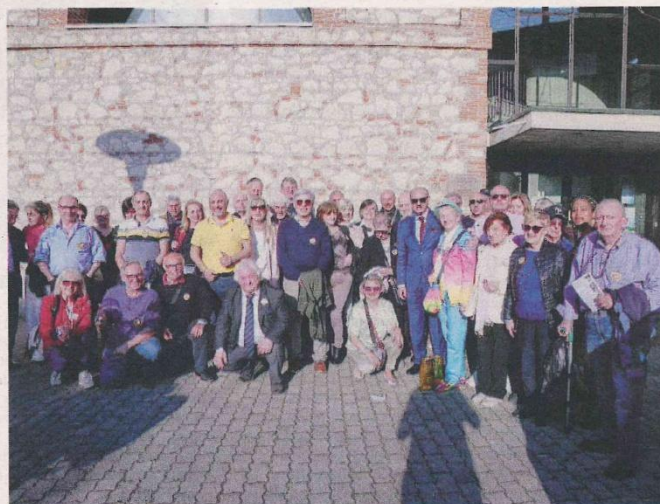
DUE IMMAGINI SCATTATE DURANTE LA GITA A VICENZA