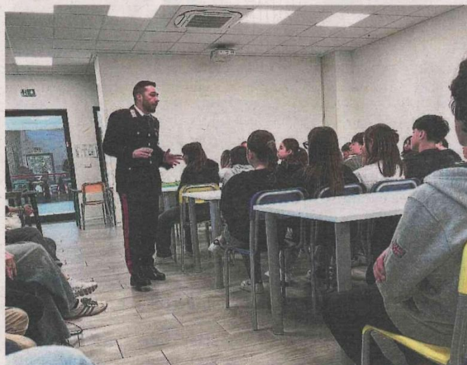
Un momento della lezione in classe