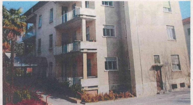
I VECCHI AMBULATORI DELL'ASL, DOVE AL PIANO TERRA VERRÀ TRASFERITA LA SEDE DELLA PRO LOCO

Per quanto riguarda invece la realizzazione degli impianti, e della parte che riguarderà l'acquisto degli arredi, la giunta Vazzoler stanzierà una nuova somma. Entro fine mese infatti verrà approvata una variazione di bilancio. Storia dell'associazione