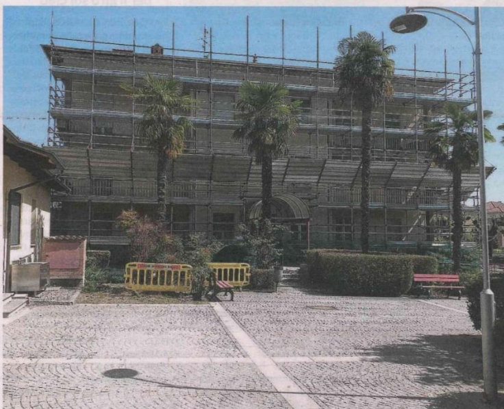
L'edificio dell'ex Asl oggetto di intervento: il Comune ricaverà la sede della Pro loco al piano terreno

Spiega Fila Robattino: «L'immobile è stato acqui-