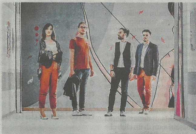
I Rebel Bit si esibiscono questasera a Vigliano

La formazione offre una sintesi delle varie influenze che hanno segnato la crescita artistica dei diversi membri del gruppo. Nelle loro performance si trovano riferimenti alla musica classica