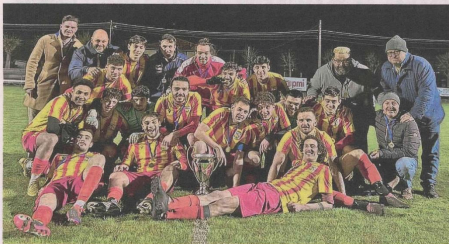
Il Vigliano posa con la coppa provinciale di Seconda/Terza Categoria: ora la fase regionale

Calcio regionale. I giallorossi dopo la conquista del titolo provinciale mercoledì hanno battuto 2-0 Grand Combin nel primo turno regionale