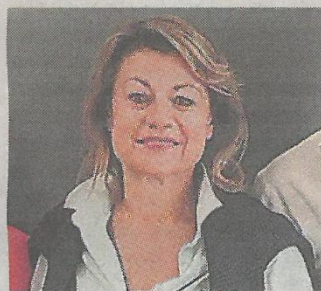
La sindaca Cristina Vazzoler

A Vigliano, da domani, ritorna l'appuntamento con «Primi passi con l'inglese», un percorso pensato per i cittadini over 65 per aiutarli a familiarizzare con la lingua più parlata al mondo che ormai, con alcuni termini come smartphone o mail, è entrata a far parte della vita di tutti, anche di chi non la conosce. L'iniziativa, che nelle precedenti edizioni ha riscosso successo, è gratuita, aperta a tutti (anche a chi parte da zero) e si terrà presso il Centro incontro Villa Comotto. Non si tratta di un corso di lingue accademico, ma di incontri pratici per impadronirsi di termini e di espressioni che fanno parte della quotidianità. «Non è mai troppo tardi per mettersi in gioco e abbattere le barriere linguistiche - dice il sindaco Cristina Vazzoler -. Mantenere la mente in esercizio è fondamentale a ogni età e imparare l'inglese oggi significa fornire vero ossigeno ai nostri neuroni. Questo percorso non solo aiuta a migliorare le capacità di concentrazione, ma permette di acquisire quelle parole chiave (dai termini digitali come cloud e device, passando dalle terminologie anglofone utilizzate dai media) indispensabili per restare connessi con il mondo moderno».