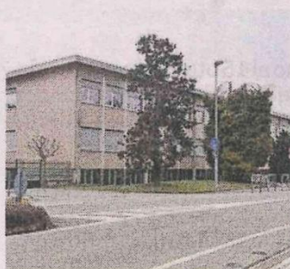
La scuola media di Vigliano

La giunta Vazzoler riconosce un interesse pubblico in questo intervento perché «senza oneri a carico del bilancio comunale valorizze-