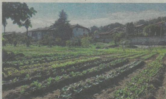
L'ORTO della cascina del Chioso a Vigliano Biellese

Sabato al Chioso la conoscenza del territorio e i momenti di condivisione verranno aperti a chiunque voglia avvicinarsi, anche solo per qualche ora, ai ritmi della campagna. La giornata si chiuderà così tra i campi.