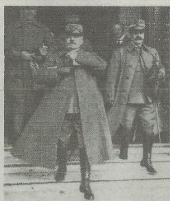
Il generale Luigi Cadorna e il sottotenente Gaia con i prigionieri ricavati dalla stessa pezza del lanificio Rivetti

Il libro propone una sorta di diario: le fotografie ritraggono giovani che sorridono, orgogliosi della loro uniforme. Sono immortalati accanto alle barecche capurre nei boschi o alle prese con pezzi di artiglieria. Sembrano più grandi del loro coetanei di