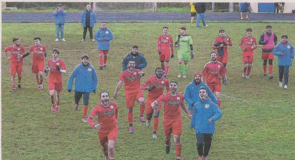
La gioia dei giocatori della Valdilana Biogliese

I tre punti sono l'esito ottenuto anche dal Vigliano. I giallorossi battono la terzultima forza del campionato Mezzomerico 4-2 anche senza la punta di dia-