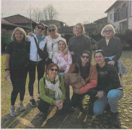
Alcune partecipanti alla camminata di domenica scorsa

L'evento aveva uno scopo salutare e uno solidale: una camminata sulle colline che incorniciano il paese è stato il modo per condividere il sostegno alle associazioni Non sei sola, Vocidonne e Donne Nuove, in particolare per il progetto della casa rifugio che accoglie le donne vittime di violenza.