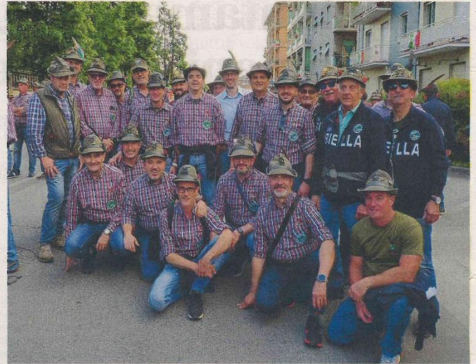
TRE FOTOGRAFIE SIGNIFICATIVE DEGLI ALPINI DI VIGLIANO

Sempre nel 1972, venne ufficializzato il gemellaggio con il gruppo di "Vittorio Veneto", assieme alla creazione del nuovo gagliardetto e allo spostamento della sede in via Dante Alighieri che li ospitò fino all'11 settembre del 1983, momento in cui gli Alpini inaugurarono quella attuale che si trova in viale Alpini d'Italia, divenuta nel tempo un importante punto di ritrovo di eventi socio-culturali per tutta la comunità. Era presente alla posa della prima pietra anche la memoria sta-