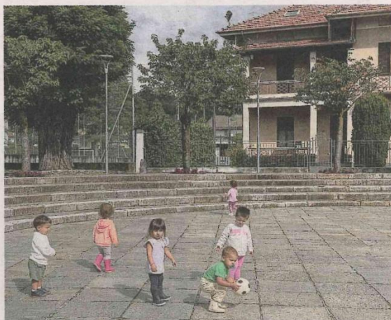
Un'immagine dell'asilo nido