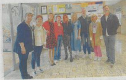
Un momento della visita nel Biellese da parte delle insegnanti svedesi