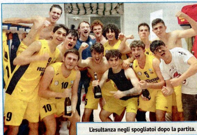
L'esultanza negli spogliatoi dopo la partita.

Il tabellino del match disputato venerdì sera tra le mura amiche.