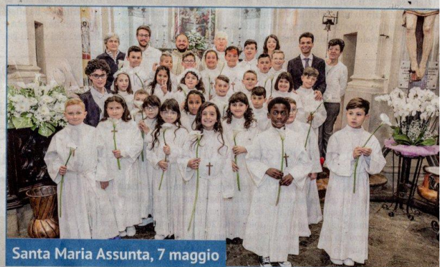
Santa Maria Assunta, 7 maggio