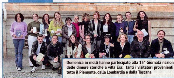
Domenica in molti hanno partecipato alla 13ª Giornata nazionale delle dimore storiche a villa Era: tanti i visitatori provenienti da tutto il Piemonte, dalla Lombardia e dalla Toscana