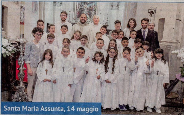
Santa Maria Assunta, 14 maggio