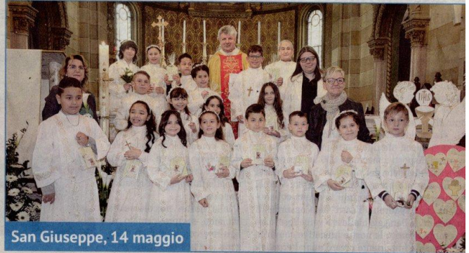
San Giuseppe, 14 maggio