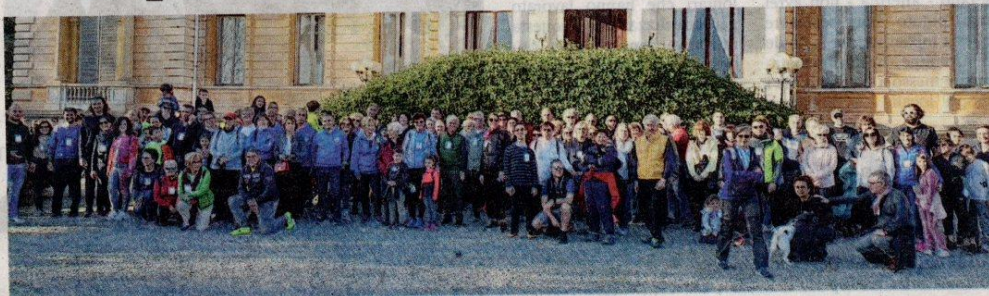
I PARTECIPANTI all'iniziativa di domenica scorsa a Vigliano Biellese organizzata da Pro Loco e Comune e altre associazioni

VIGLIANO BIELLESE «La parola "grazie" va ripetuta almeno 331 volte ripensando all'iniziativa svoltasi a Vigliano domenica scorsa, una per ogni partecipante alla camminata che ormai da qualche anno contrassegna la giornata internazionale della donna e che viene dedicata alla beneficenza». I ringraziamenti arrivano al Fondo Edo Tempia per la donazione fatta a seguito della manifestazione "La vita corre" organizzata a Vigliano dalla Pro Loco in occasione della Giornata Internazionale della Donna in collaborazione con l'Assessorato alle Pari Opportunità, Villa Era e Podistica Biellese. Oltre al Fondo sono state sostenute le associazioni Non sei sola, Vocididonne e Donne Nuove. L'evento si è caratterizzato con una camminata non competitiva di 4 chilometri verso Villa Era, con la visita al parco, alle cantine e agli splendidi interni. «Ma 331 volte non bastano perché - bisogna aggiungere alla lista anche la Pro Loco di Vigliano Biellese e il Comune - aggiunge una nota del Fondo Edo Tempia - che anche quest'anno hanno deciso di devolvere parte del ricavato alla nostra associazione».