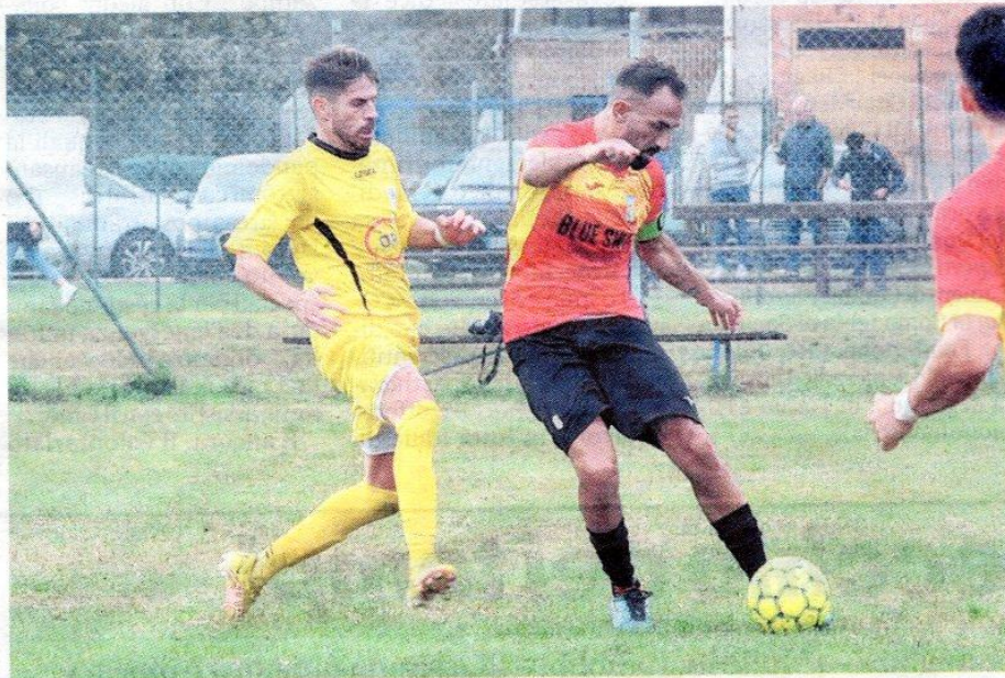
Stagione veramente da dimenticare per il Vigliano