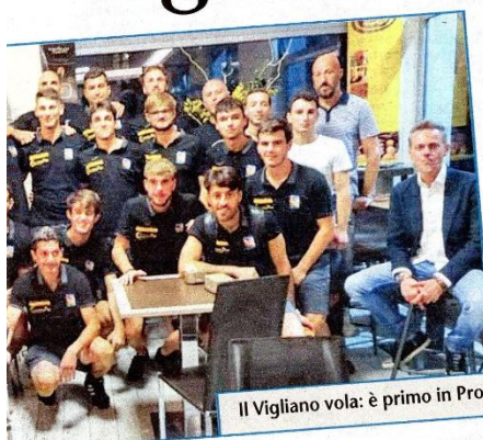
Il Vigliano vola: è primo in Promozione