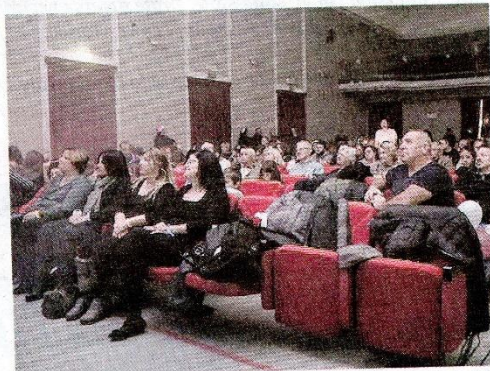
Lo spettacolo si terrà al Teatro Erios

Lo stile narrativo coniuga il taglio divulgativo e quello teatrale, grazie all'interpretazione dell'attore-divulgatore, che racconta esperienze personali, punti di vista, valutazioni insieme a fatti scientifici ambientali, climatici, geologici, evolutivi e storici. Nel monologo il concetto di evoluzione come storia positiva che si sviluppa fino all'Uomo, ar-